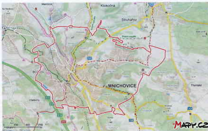
Mapa města Mnichovice.

Město Mnichovice a jeho 3 950 obyvatel obsluhují 3 autobusové (489, 490 a 495) a 2 železniční linky (S9 a R49). Město má 3 místní části: Božkov (cca 700 obyvatel), Mnichovice (cca 3000 obyvatel) a Myšlín (cca 250 obyvatel). Váha významnosti linek je nejprve rozdělena podle počtu obyvatel v místních částech: Božkov 0,18; Mnichovice 0,76 a Myšlín 0,06.