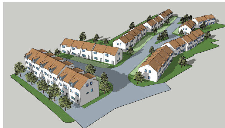
ŘADOVÉ RODINNÉ DOMY