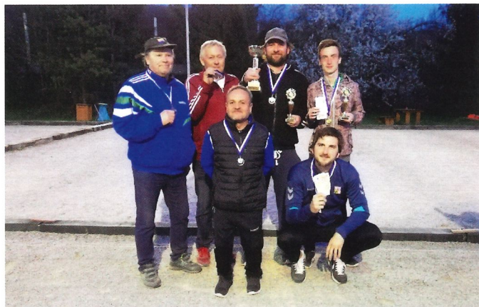
Medailisté Nakashi Cup 2019

70 a právo organizovat turnaj kategorie PRESTIGE má každý rok pouze 8 klubů z ČR. Tuto kategorii si držíme již 6 let, což věříme, že svědčí o našich pořadatelských kvalitách. Nejsme ale jen dobrými pořadateli, ale v posledních letech i dobrými hráči, kteří se umísťují pravidelně na předních pozicích turnajů po celé ČR. Z posledních 12 turnajů, kterých se zúčastnili naši hráči, jsme 5 turnajů vyhráli a spolu s klubem PC Sokol Lipník aktuálně vládneme českému Pétanque v počtu vítězství za posledních 6