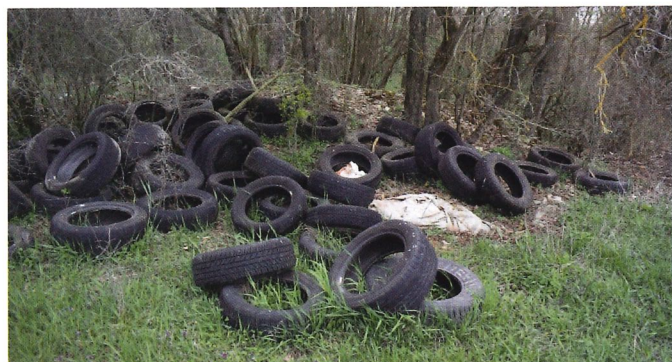
To asi není od soukromníka

O týden později se za ne úplně příznivého počasí hromadně uklidu věnovali i obyvatelé bytového domu u GZ. Celkem 15 obyvatel se potýkalo především s rozšířenými dřevinami, plasty a nedopalky. Těch byly opravdu velké hromádky. Jedna z účastnic uklidu mi