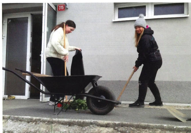
I mladí umí přiložit ruku k dílu

prozradila i tip od své maminky kuřačky, která nepotřebuje mít na každém kroku odpadkový koš. Miniaturní obal na nedopalky nosí sebou a pak jen příležitostně vyprázdni tam, kam tento odpad patří.