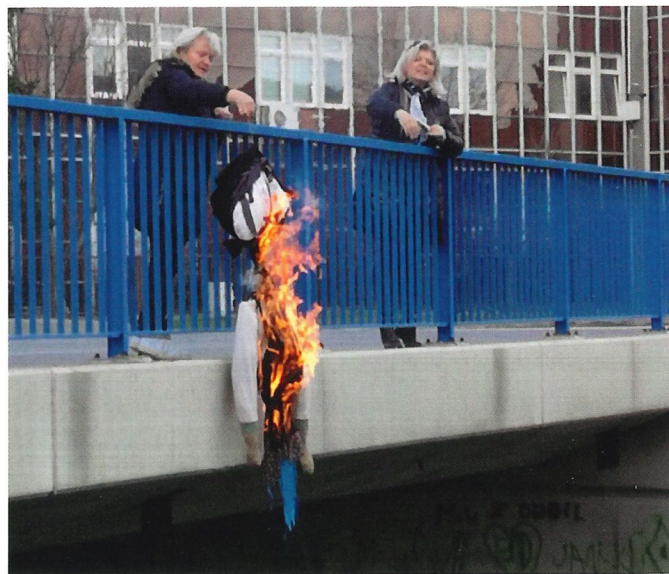
Byla to opravdová krasavice

Dětem se vycházka evidentně líbila a zpátky do školky se vrátily se spoustou nových zážitků a já se