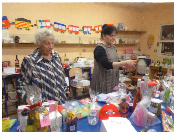
Tombola byla opravdu bohatá a rozmanitá