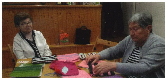
Iniciátorky pletení v Klubu volného času

Už vůbec ale není samozřejmé, že jsou lidé, kteří ve svém volném čase jezdí do domovů pro neslyšící nebo do domovů důchodců a tráví s nimi čas při ručních pracích, nebo jen tak na procházkách či u šálku kávy. (Kdyby se chtěl někdo přidat, kontakt mohu zprostředkovat).